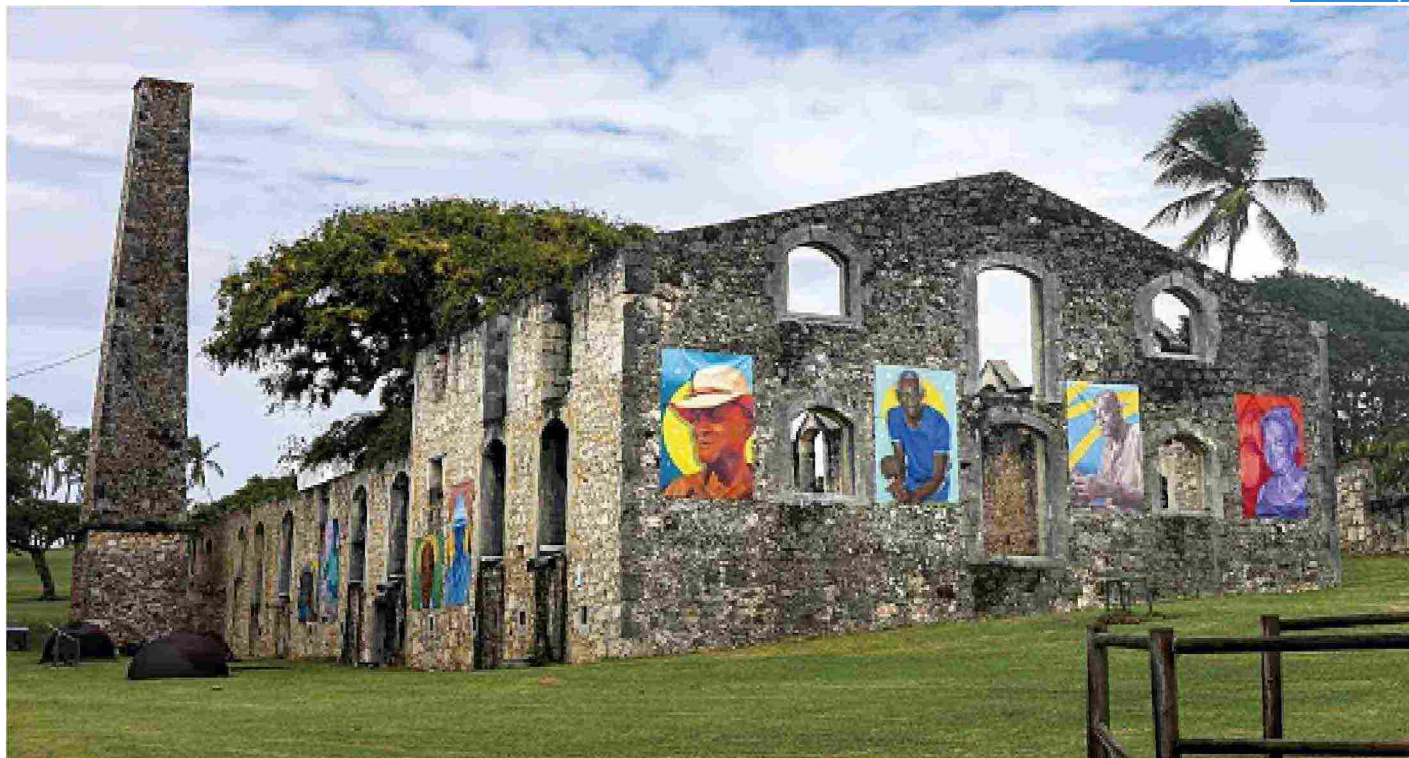
● Marie-Galante: l'habitation Murat, dimora storica con ecomuseo e, nella pagina accanto, la spiaggia di Anse Canot.