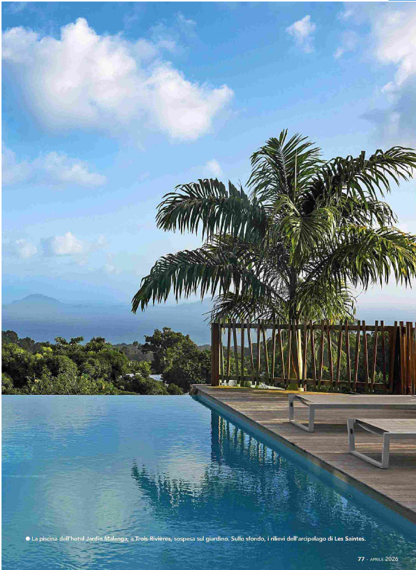
● La piscina dell'hotel Jardin Malanga, a Trois-Rivières, sospesa sul giardino. Sullo sfondo, i rilievi dell'arcipelago di Les Saintes.