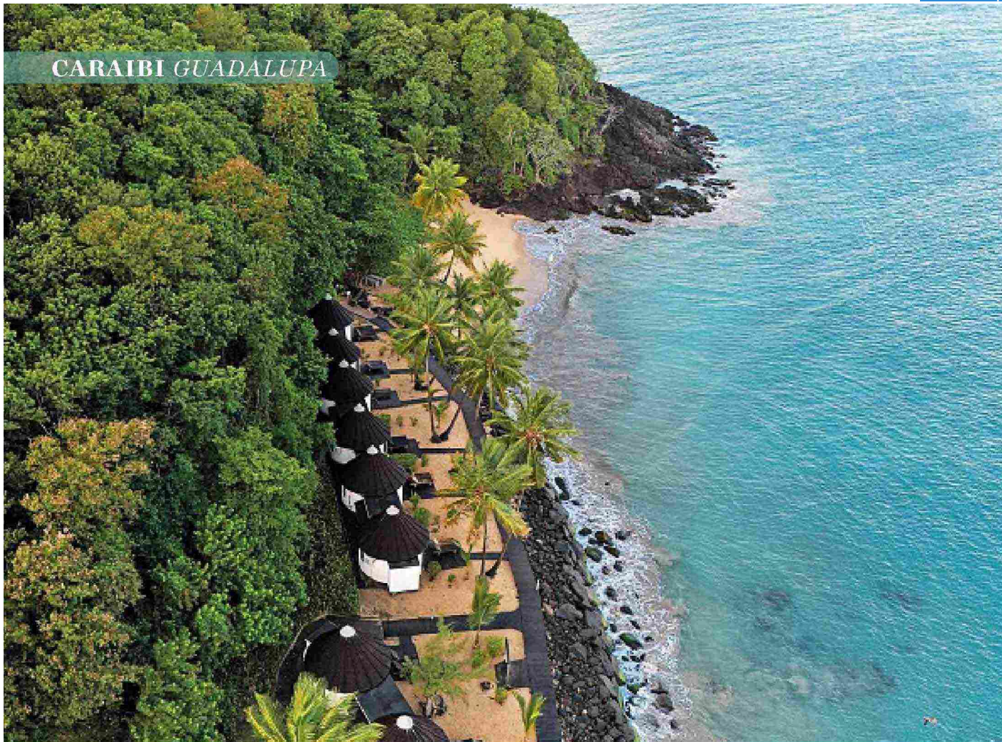
● I bungalow pieds dans l'eau del Langley Resort Fort Royal, a Deshaies.

franco-britannica Delitti in Paradiso , è piacevole sorseggiare un Ti'punch al tramonto. Bisogna, però, essere sicuri di saperlo assestare, questo “piccolo pugno” che sferza la gola: lime e zucchero (o sciroppo) di canna vanno ben dosati e spremuti prima di aggiungere il rum, bianco e agricolo. Sulle fasi di preparazione ci si sentirà dire: “Ognuno prepara la sua morte”. Il gusto, in realtà, richiama un senso immediato di beatitudine.