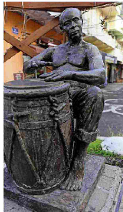
● Una venditrice di spezie al mercato di Sainte-Anne; un murale che ritrae un pescatore a Marie-Galante; la statua di un suonatore di gwo ka a Pointe-à-Pitre. Nella pagina accanto, l'arco di pietra Gueule Grand Gouffre, sulla costa settentrionale di Marie-Galante.

tuk-tuk su cui racconta la sua città. “Poi ci fu il tradimento di Napoleone, che andando contro i principi della Rivoluzione francese ripristinò, nel 1802, la schiavitù”. La sosta più lunga del suo tour è in vista delle architetture “ramificate” del Mémorial ACTe : molto più di un museo, è una vera esperienza tridimensionale fra rotte negriere, le pratiche scabrose del Code Noir , le leggi che regolavano la vita degli schiavi, magnifici ori portoghesi. Fuori, nel tramonto che infiamma la Rivière Salée , fiume salato che divide in due l'isola principale, si ritrovano tanti bimbi che sfrecciano allegri, caschetto e monopattino. Ignari di alcuni faticosi passaggi della storia.