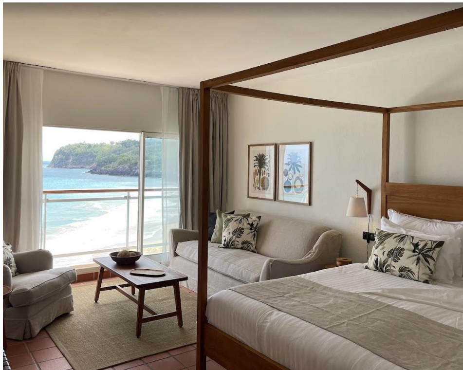
Le Resort Langley Fort Royal