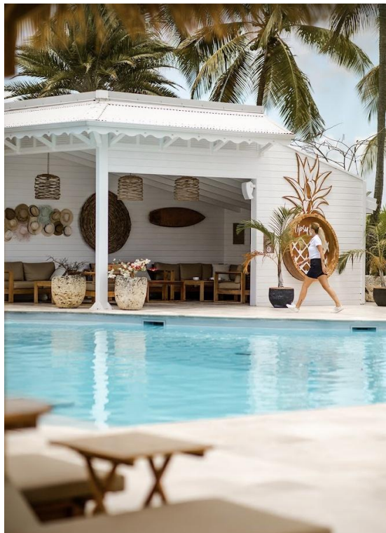
Le Relais du Moulin & Spa © DR