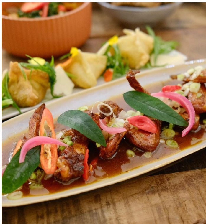
Maison Victoire

Mco saveurs , Sainte-Anne : ce restaurant gastronomique créole propose des saveurs antillaises authentiques et fraîches, allant du carpaccio de chatrou aux viandes, poissons et desserts impressionnants, le tout à des prix attractifs. Pavillon Sainte-Anne, 97180 Sainte-Anne | +590 690 401961