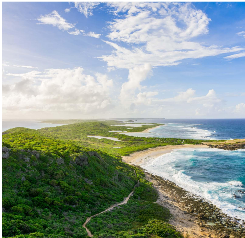
Pointe des Châteaux, Grande-Terre