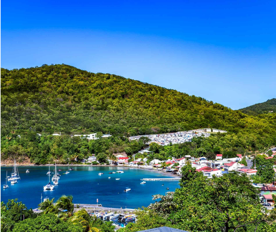
Visiter la Guadeloupe et Deshaies