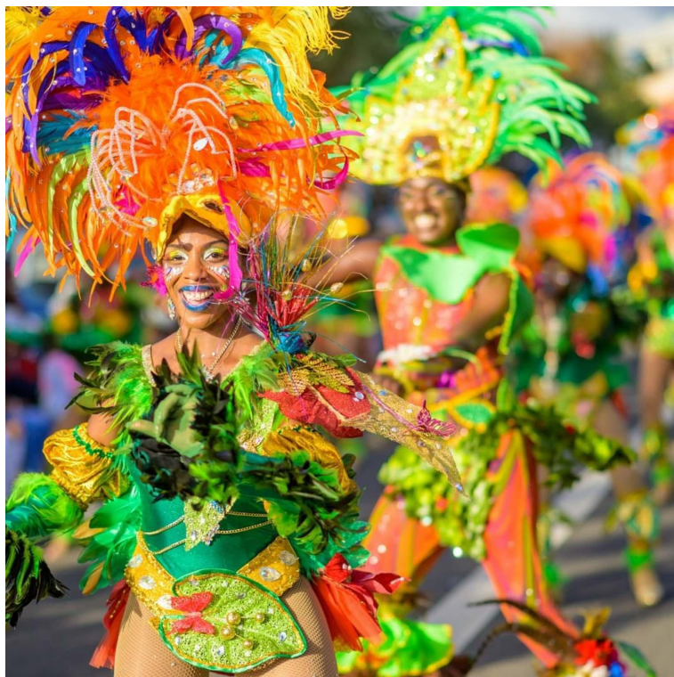
Le Carnaval de Guadeloupe