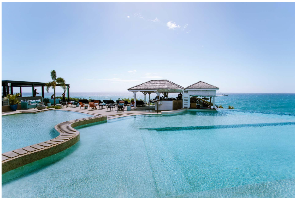
La piscine de La Toubana, seul 5 étoiles de Guadeloupe

La Creole Beach, Hôtel & Spa : cet hôtel 4 étoiles est idéal pour les voyages en famille, entre amis ou pour des séjours professionnels en Guadeloupe. Il propose des chambres confortables, une grande piscine, une plage privée, plusieurs restaurants et bars, un spa, une salle de fitness et des animations. Pointe de la Verdure, Gosier 97190 | (+590) 5 90 90 46 46