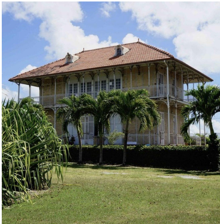
Habitation Zévallos