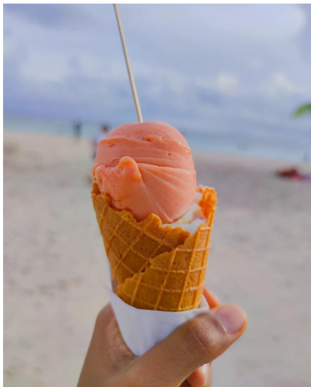
Glace de chez Youyoutte