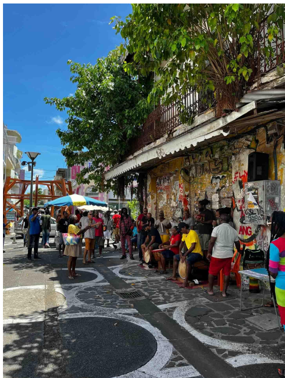
Pointe à Pitre