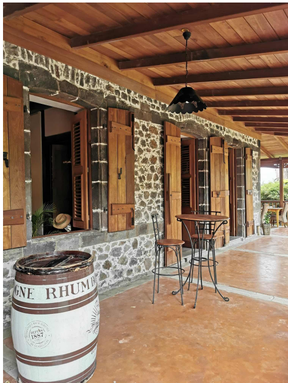
Habitation Desmarets

Le Rivage, à Capesterre-Belle-Eau : super petite adresse située sur la plage de Bananier avec une belle vue sur les îlets des Saintes. La cuisine est simple et locale, proposant des langoustes grillées, du poisson du jour, des ouassous à la nage, du colombo, du chatro, et des accras. Bd de Bananier, Capesterre-Belle-Eau 97130 | +590 590 86 02 40