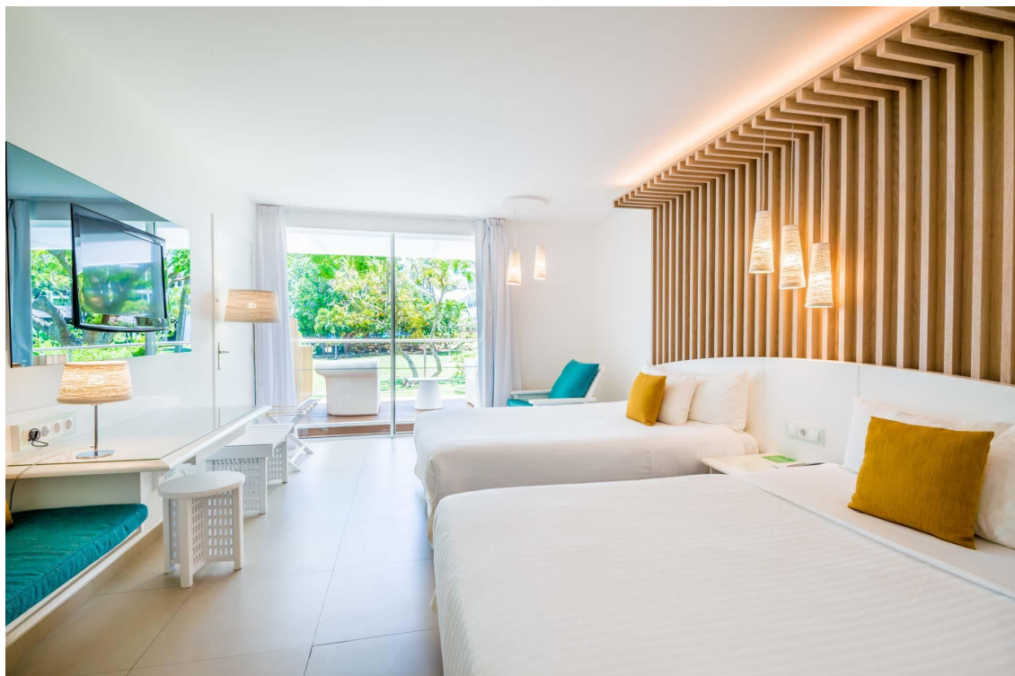
La Créole Beach Hôtel & Spa

Hôtel Le Cocotel : situé à Saint-François, cet hôtel 4 étoiles offre des services haut de gamme et personnalisés. Il propose des chambres confortables, une piscine majestueuse, un spa, un petit-déjeuner savoureux et un bar. rue de Kerdoret, Saint-François 97118 | +590 690 95 50 30