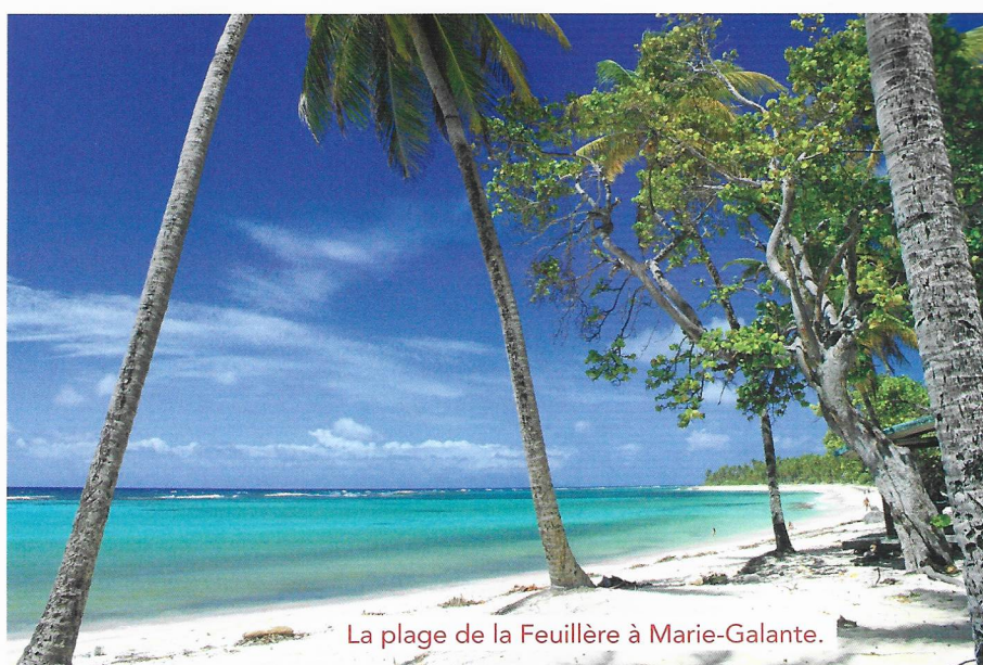
La plage de la Feuillère à Marie-Galante.

Battue par la houle de l'océan, la Désirade appartient à l'Atlantique. Au large de la Guadeloupe, Christophe Colomb l'espéra, l'appela de ses vœux et c'est ainsi qu'en se montrant enfin, cette île à la silhouette pourtant austère voire intimidante, balayée par les alizées, fut baptisée. Aux Antilles, sa position à l'est lui donne des faux airs de Finistère. Un bout du monde de plus en plus apprécié par les visiteurs qui veulent sortir des sentiers battus.