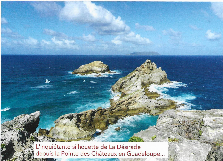
L'inquiétante silhouette de La Désirade depuis la Pointe des Châteaux en Guadeloupe...