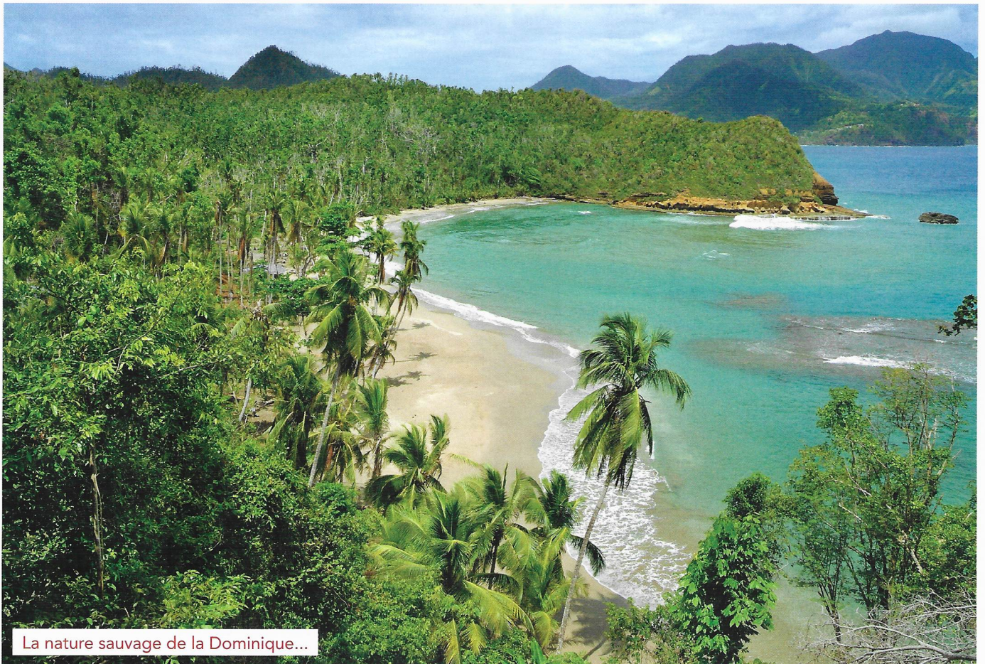
La nature sauvage de la Dominique...

Surnommée l'île « Emeraude » ou encore l'île « Papillon » car, vue du ciel, ses deux îles rappellent la forme des ailes d'un papillon, la Guadeloupe est surtout une île à forte personnalité, mélange d'atmosphères et de paysages hauts en couleurs. Sur Grand-Terre, les plus belles plages courent sur la côte qui s'étend de Sainte-Anne jusqu'à la Pointe-des-Châteaux, parsemée de cocotiers obliques. Baignées par un lagon limpide et turquoise et protégées par une belle barrière de corail, on trouve sur cette longue bande de sable blanc ce que l'on vient y chercher, c'est à dire la carte postale typique des Antilles, avec en prime une foule de petits restaurants locaux joliment baptisés « lolos » où accras et ti-punchs musclés seront vos compagnons favoris le temps de votre séjour. A La Pointe-des-Châteaux, on peut même dévorer une langouste tranquillement installé à une table à demi immergée dans le lagon, très peu