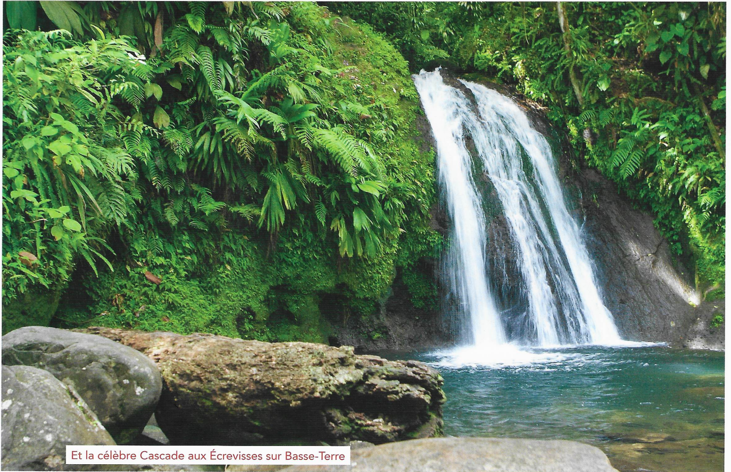
Et la célèbre Cascade aux Écrevisses sur Basse-Terre