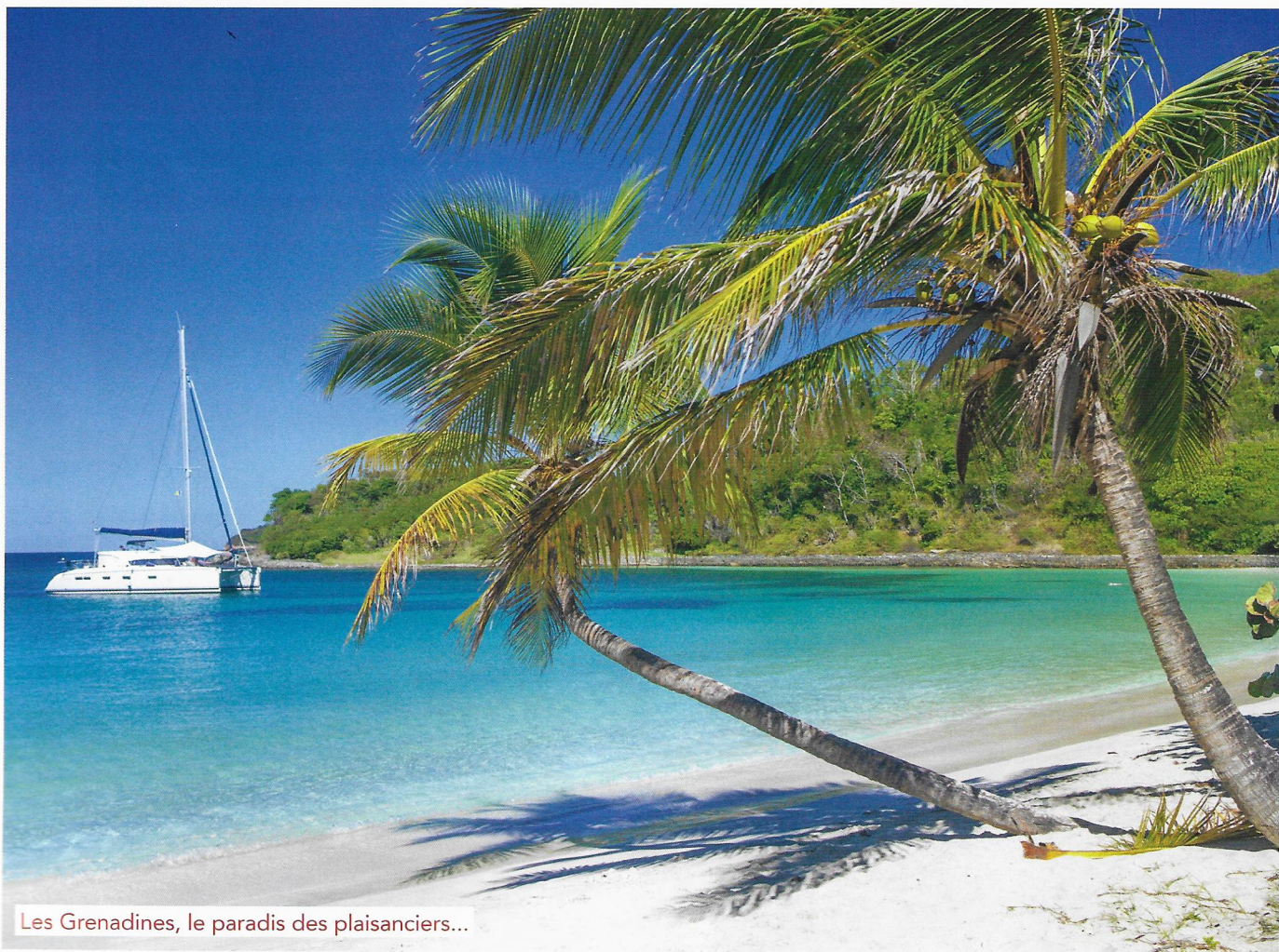
Les Grenadines, le paradis des plaisanciers...

Une ribambelle d'îles basses sur l'eau, avec renforts de cocotiers et de sable blanc, voilà en deux mots les Grenadines. Si Saint-Vincent est la capitale, l'île de Mustique est la plus réputée, pour, dans les années 60, avoir accueilli la princesse Margaret qui transforma l'île en une sorte de Saint-Tropez des tropiques. Aujourd'hui encore, c'est là que le Prince