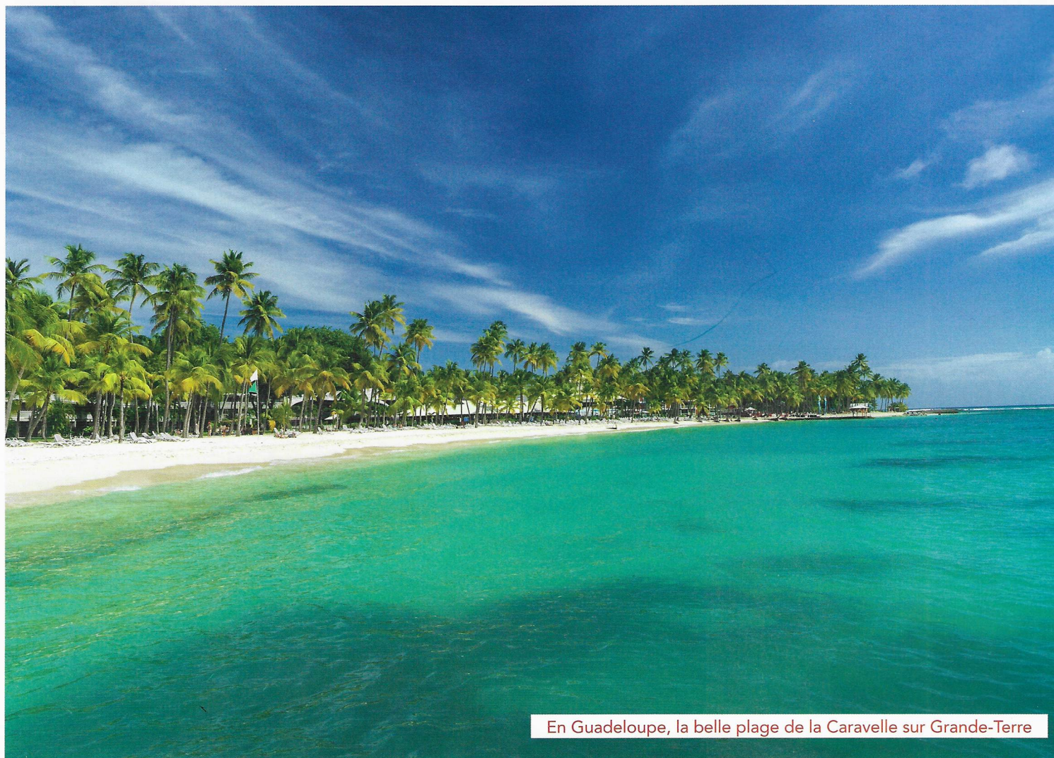
En Guadeloupe, la belle plage de la Caravelle sur Grande-Terre

profond à cet endroit : une expérience à la fois insolite et très amusante à s'accorder au moins une fois ! À moins que vous ne préfériez déguster un rhum coco accompagné d'un poisson grillé dans le petit restaurant hippie multicolore tout au bout de la Pointe que vous ne pourrez pas rater. Grande-Terre est ainsi la partie la plus animée de l'île, avec ses marchés typiques, ses boutiques et c'est aussi là que sont installés la plupart des hôtels de toutes catégories, depuis la petite pension familiale jusqu'aux hôtels de standing. Au nord et à l'est de l'île, de jolies falaises dominant l'Atlantique, tandis que l'ouest abrite une impressionnante mangrove, que l'on peut d'ailleurs parcourir le temps d'une randonnée à jet-ski d'une demi-journée qui vaut vraiment le détour. Sur Basse-Terre, changement d'ambiance complet. Place à une nature sauvage, à la jungle primaire et à une atmosphère plus tranquille, avec de merveilleux spots à ne pas manquer comme le Volcan de la Soufrière (1467m et plus haut sommet des Petites Antilles), la Cascade aux Ecrevisses, le village perché de Deshaies avec son jardin botanique et sa belle plage de sable ocre, ou encore la commune de Trois Rivières d'où l'on appareille pour les Saintes.