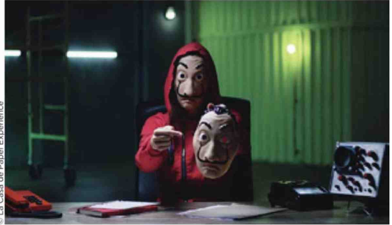
© La Casa de Papel Experience

C'est reparti ! Du 3 au 6 avril, la quatrième édition de Normandie Impressionniste (qui pourrait être annulée à cause du Covid-19) viendra célébrer la création artistique de l'Impressionnisme à nos jours, sous toutes ses formes. Expos, danse, théâtre, photographie, littérature... Ce festival pluridisciplinaire promet un programme riche et diversifié, ouvert à tous les publics. Son fil conducteur ? « La couleur au jour le jour », un thème déroulé du côté de Rouen, Giverny, Dieppe, Caen ou encore du Havre... En Normandie, 2020 sera aussi marquée par l'ouverture d'un nouveau lieu culturel, dans l'ancien couvent des sœurs franciscaines, à Deauville, autour de thèmes chers à la ville : le cheval, le cinéma, le spectacle, la photographie ou l'art de vivre.