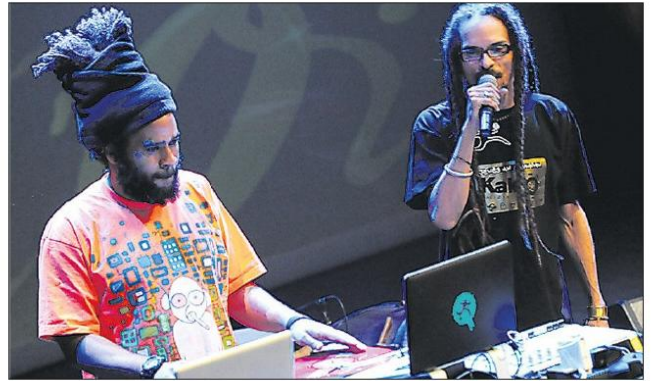
Jeudi 21 juin, à 20 heures, place de la Commémoration, au Mémorial ACTe, à Darboussier/Pointe-à-Pitre. Accès libre.

Dans le cadre du cycle Mémoires urbaines et à l'occasion de la fête de la musique, le Mémorial ACTe, à Pointe-à-Pitre, reçoit le Kako labo. Le laboratoire de recherches musicales autour du son Kako, initié par les incontournables Exxòs et Doob6 (auteurs compositeurs, DJ et ingénieurs du son). Le duo examine et décortique les pratiques traditionnelles et techniques modernes, et